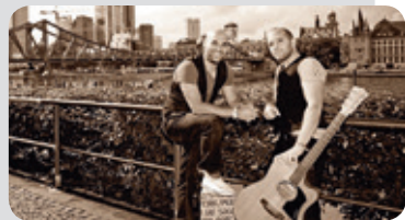
mit dem FINANZKRISE Duo